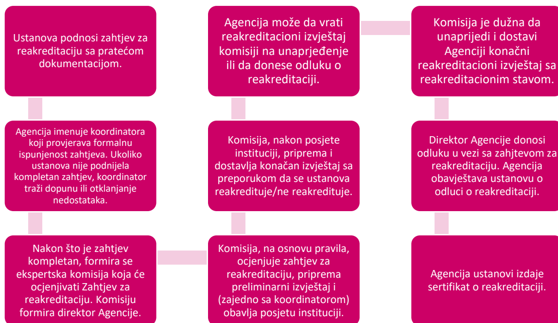
Slika 3. Postupak reakreditacije studijskog programa

U 2019. godini Agencija je primila 1 zahtjev za reakreditaciju ustanove (Fakultet za državne i evropske studije). Kao što se može vidjeti iz Tabele 2., tokom 2019. godine, reakreditovane su 3 ustanove visokog obrazovanja (na osnovu zahtjeva iz 2018. i 2019. godine), dok je 7 zahtjeva za reakreditaciju u postupku provjere formalne ispunjenosti. Jedan zahtjev za reakreditaciju se odnosi na univerzitet, 1 na samostalni fakultet, dok se 5 zahtjeva za reakreditaciju odnosi na reakreditaciju fakulteta Univerziteta Adriatik, kao samostalnih ustanova (detaljan prikaz u Prilogu, Tabela 2.2. Postupci reakreditacije ustanova visokog obrazovanja u 2019. godini).