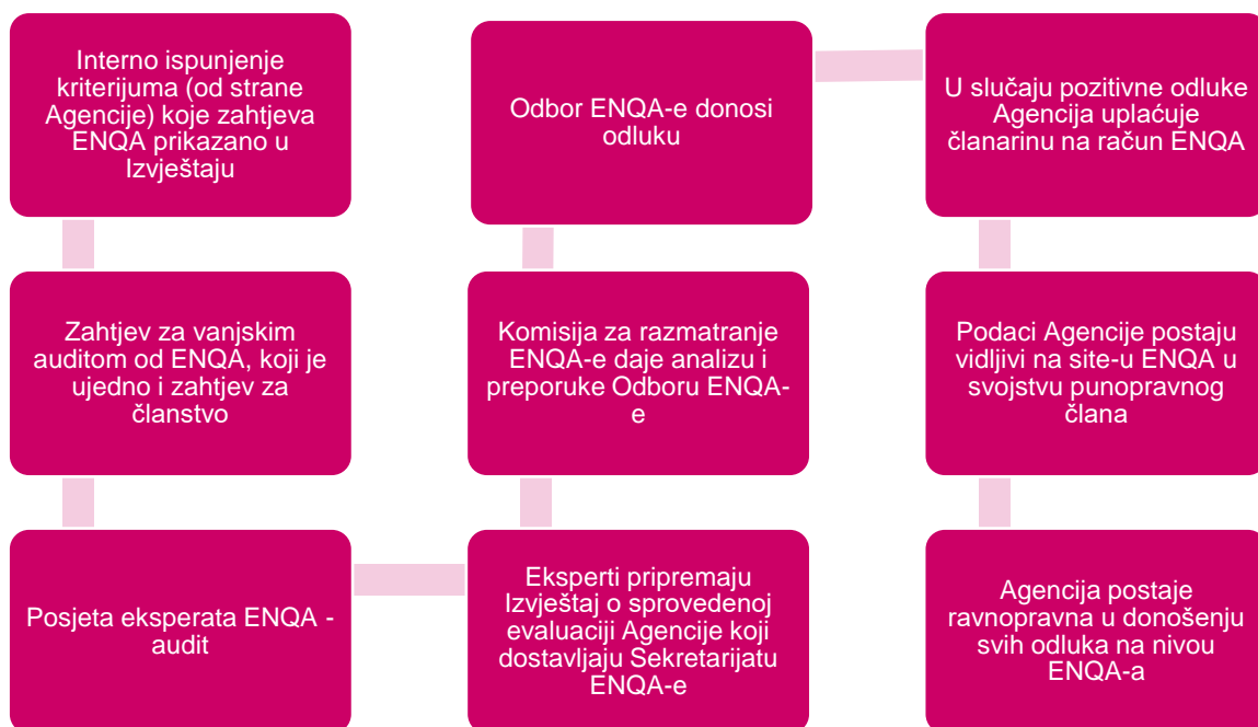
Slika 1. Šematski prikaz postupka evaluacije kvaliteta AKOKVO od strane ENQA-e

ESG se sastoji iz tri dijela koji zajedno čine ukupno 24 standarda (standardi su nabrojani u Prilogu, Tabela 1.1), koja su suštinski međusobno povezana, dopunjuju se i zajedno, kao cjelina, čine osnovu evropskog okvira obezbjeđenja kvaliteta: